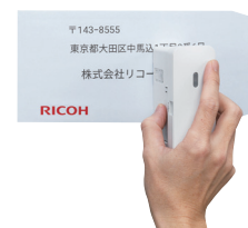
RICOH Handy Printer