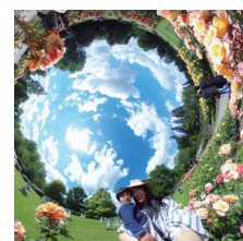
RICOH THETAで撮影した 360°画像