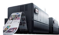
RICOH Pro VC70000