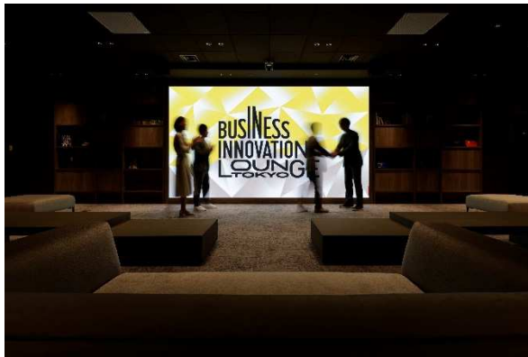
究極の対話にむけたゲストを迎える：Climbers Lounge

リコーは、デジタルサービスの会社としてお客様の生産性向上や業務効率化を実現し、その先にある創造性の発揮を支援することで、お客様のはたらく歓びを実現する新たな価値創造に取り組んでまいります。