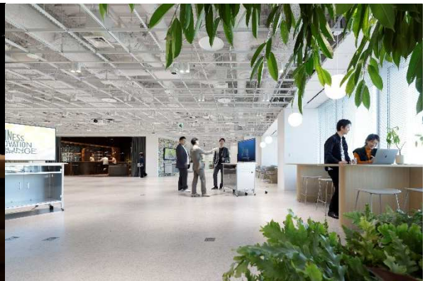
技術展示デモンストレーションエリア