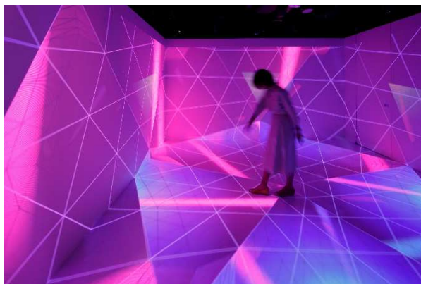
創造力を掻き立たせる空間でマインドセットする：RICOH PRISM