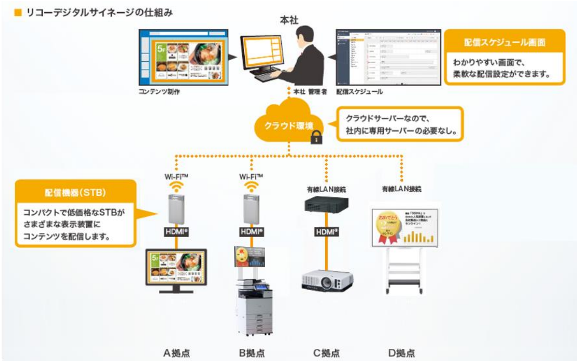
リコーデジタルサイネージの仕組み