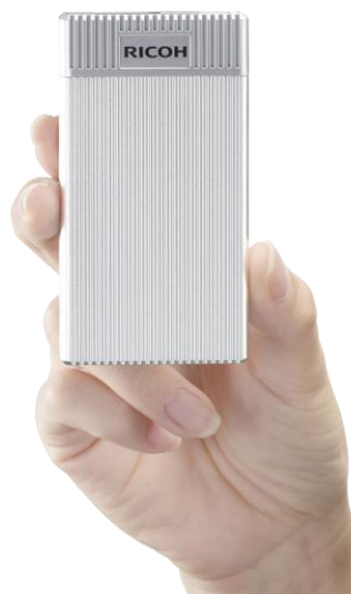
「RICOH Digital Signage STB Type1」

株式会社リコー(社長執行役員:山下良則)は、リコーが手掛けるクラウド型サイネージ配信サービス「RICOH Digital Signage(リコーデジタルサイネージ)」に対応した小型・軽量のセットトップボックス(STB)の新製品「RICOH Digital Signage STB Type1」を10月1日に発売します。さらに、10月9日(予定)にクラウドサービスをリニューアルし、ユーザーインターフェース(UI)の刷新および機能追加を実施することで、オフィスサイネージ市場を中心にお客様へより便利で使いやすいデジタルサイネージサービスを提供します。