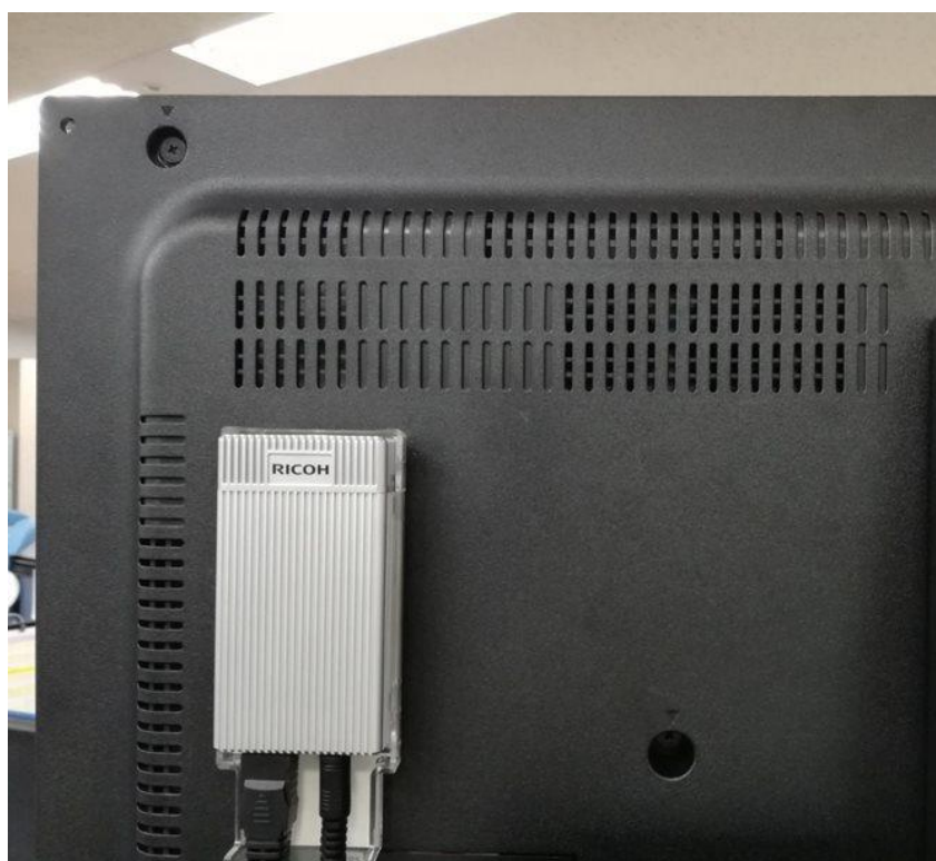
同梱の専用ケースでディスプレイの背面に直接貼り付け

リコーは今後も、オフィスや現場といったさまざまなワークプレイスで行われる仕事をデジタル化し、お客様の生産性向上や売上拡大に貢献します。そして、オフィスと現場をデジタルでつなぐデジタルビジネスを推進し、“はたらく”をよりスマートにすることで、お客様のさらなる成長を支援してまいります。