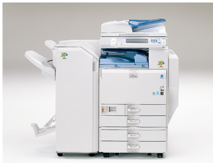
imagio MP C3500RC