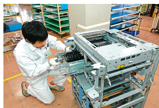
リコンディショニング作業