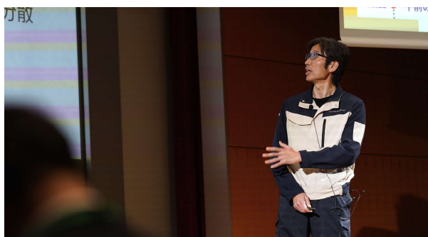
社内チームピッチの様子