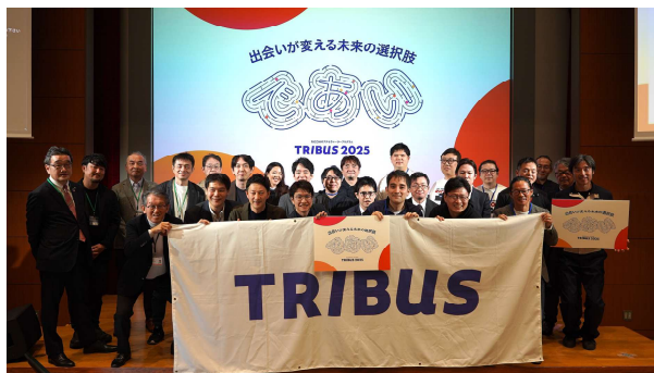
登壇者、審査員 集合写真