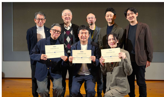
「TRIBUS 2021」社内起業家チームの卒業式の様子