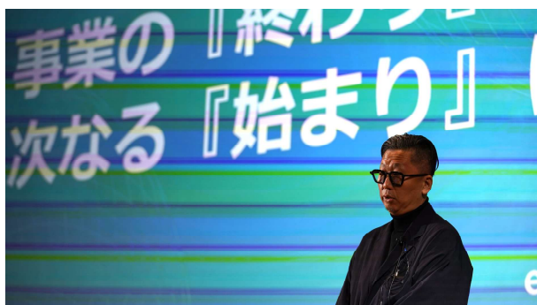
卒業生ピッチの様子