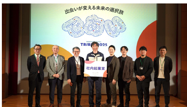
社内新規事業通過チーム