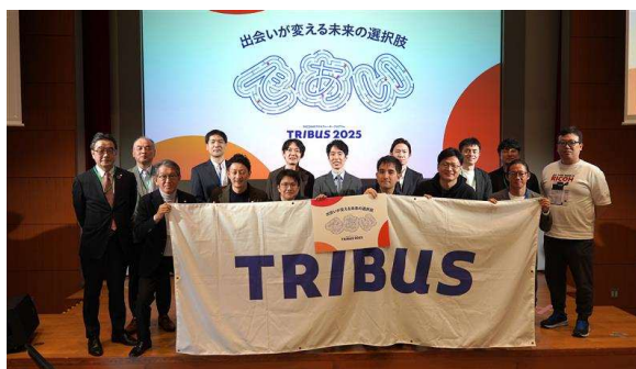
登壇スタートアップ企業