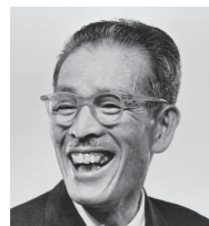
創業者 市村清 (1900年-1968年)