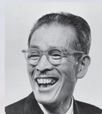
創業者 市村清 (1900年-1968年)

「三愛精神」は、1946年にリコーの創業者、市村清が提唱したもので、リコーグループでは創業の精神と位置づけています。これは、事業・仕事を通じて、自分、家族、顧客、関係者、社会のすべてを豊かにすることを目指した考えで、リコーグループの全社員が、経営や仕事を行ううえで原点となるものです。