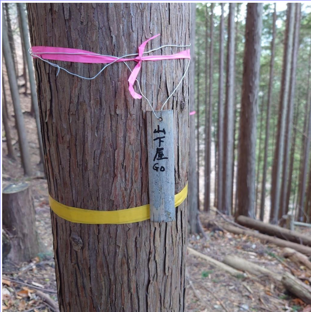
ここも昔の標識はほとんど読めなくなっていました