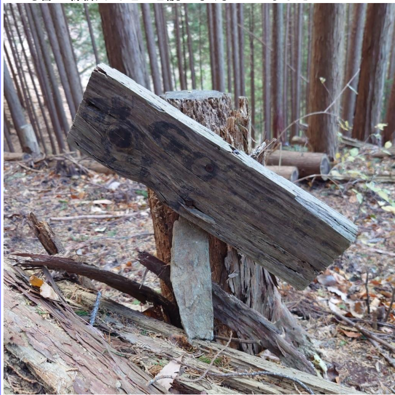
「バス停」の手書き標識