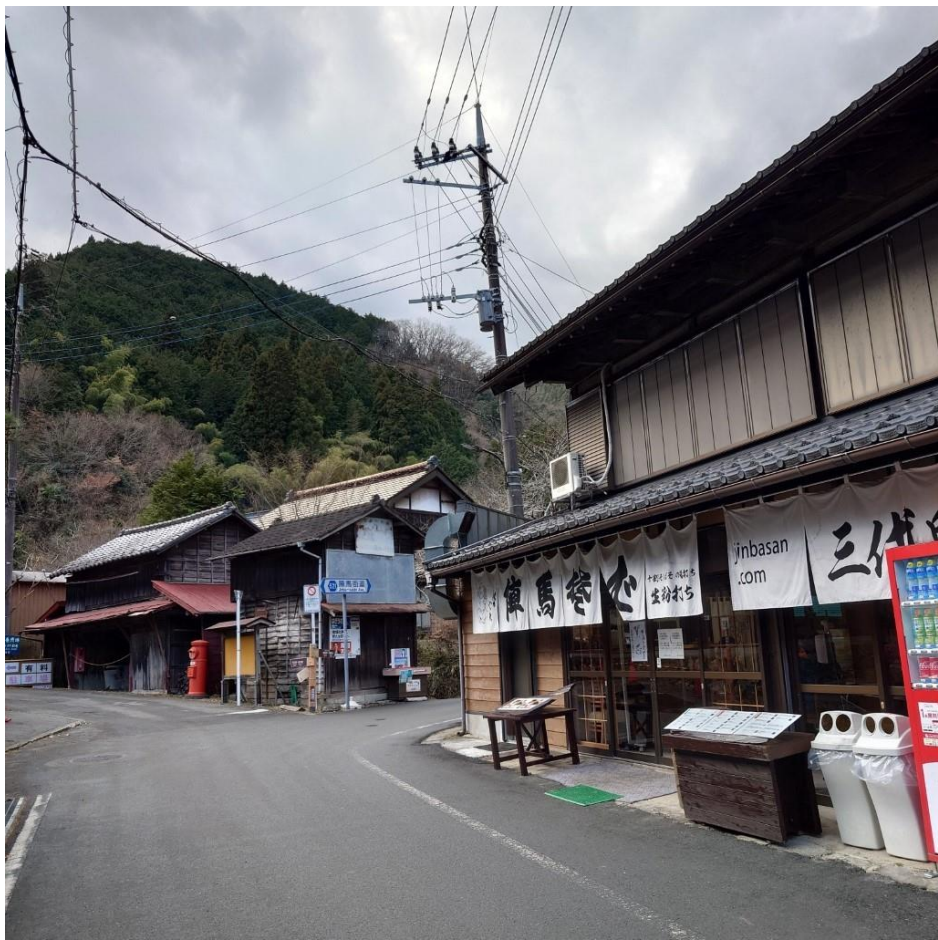
いつものように一杯やってバスで帰宅