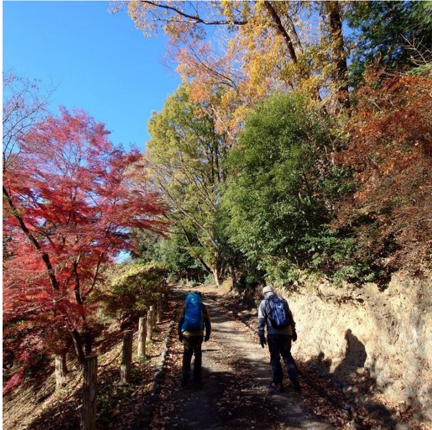
辛垣山(辛垣城跡)への登り、戦国時代の三田氏の居城です