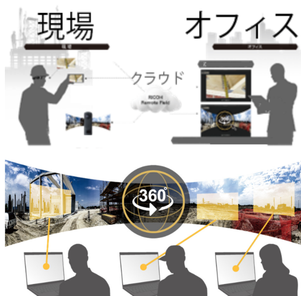
Fig. 5 Overview of Remote Field.

Fig. 5は360度カメラを用いた配信サービスRICOH Remote Fieldの概念図である。このサービスは、RICOH THETAによる360度高解像度映像と低遅延配信を特徴とする遠隔現場支援システムである。特に閲覧者が任意の点を見ることができ点が最大のメリットである。閲覧に際しては、専用アプリ不要でブラウザからアクセス可能であり、発注者・受注者間の立ち会いや安全パトロール、リモート点検など多様な業務に応用される。これにより移動時間やコストの削減、危険現場での安全性向上に寄与する。