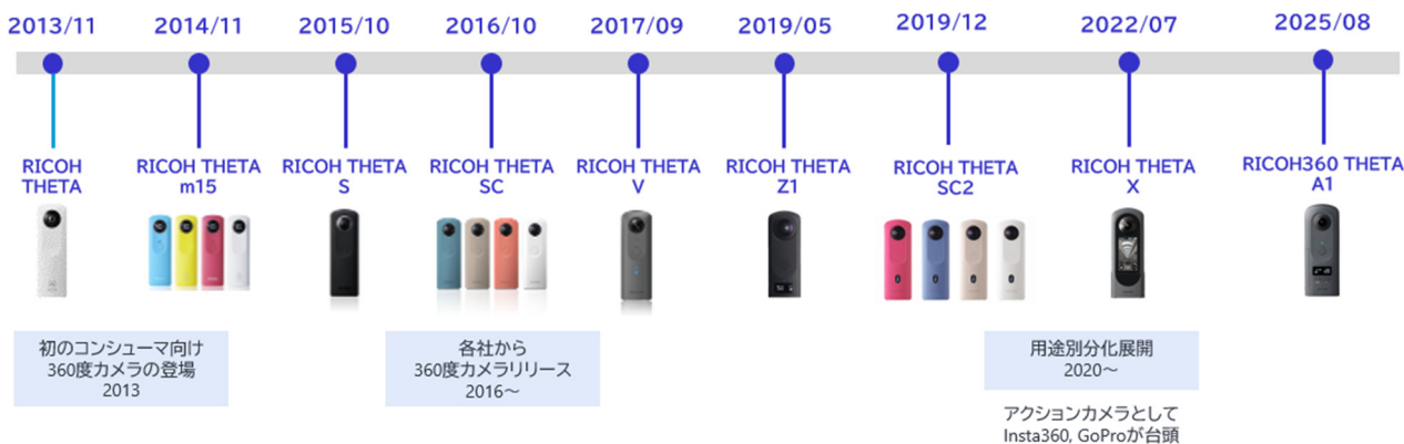
Fig. 1 History of THETA series and 360-degree camera market.