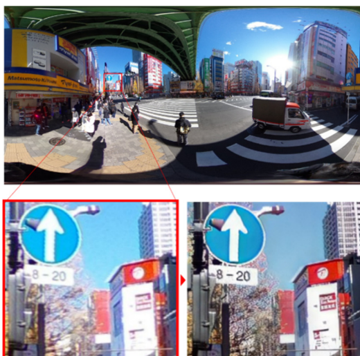
Fig. 4 Result of Image Enhancement.

この研究では、Residual-in-Residual Dense Block (RRDB) および畳み込み層を用い、高周波成分と低周波成分の特徴を同時に抽出可能な多周波構造を組み込んだGAN (Generative Adversarial Network) アーキテクチャを設計し、学習を行った。その結果、360度画像の高速かつ高精度な画質強調を実現することが可能となった。