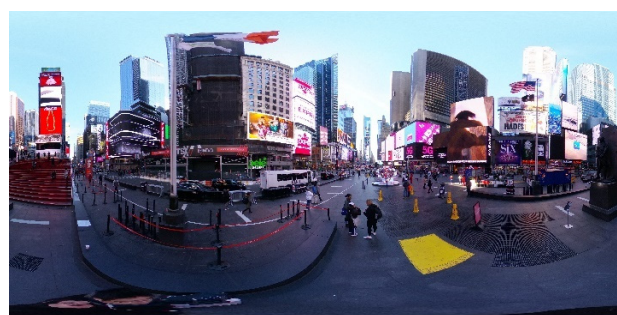
Fig. 3 Equirectangular projection captured by 360-degree camera.