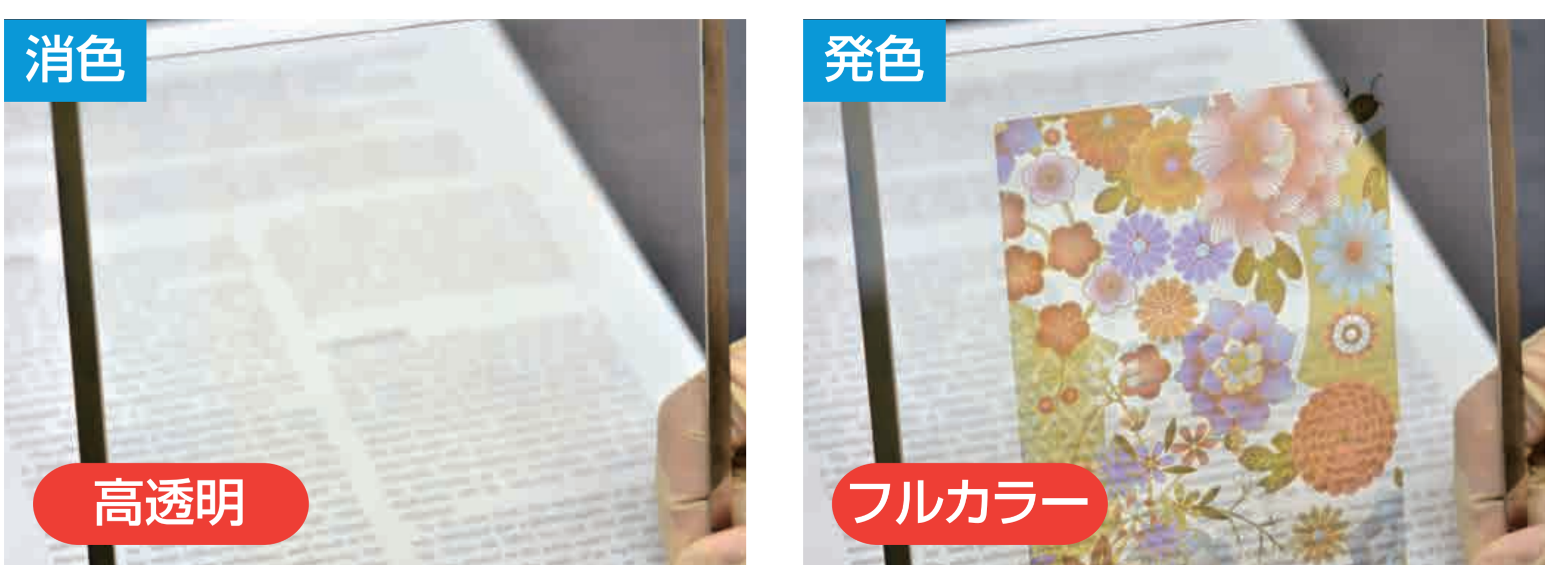
フルカラーアートガラス試作例