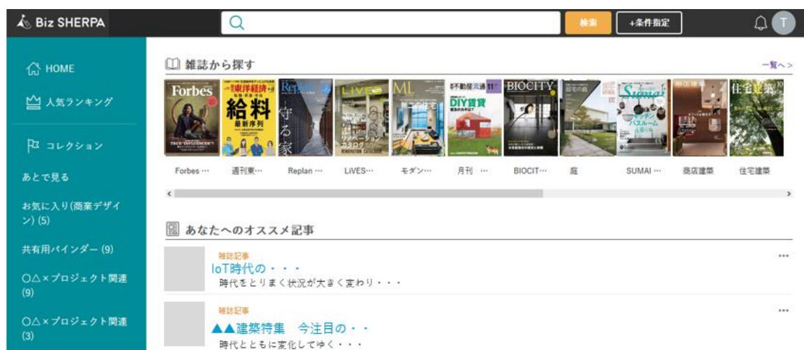
「Biz SHERPA (ビズ・シェルパ)」画面イメージ

※ 紙の雑誌を想定した誌面 PDF データは、レイアウトが固定され、それ以上の編集加工が難しく、ウェブサイトやスマホアプリへの転用には適さないため、PDF データから汎用性の高い状態に変換されたテキストや画像単位の各種データを「マイクロコンテンツ」と呼びます。