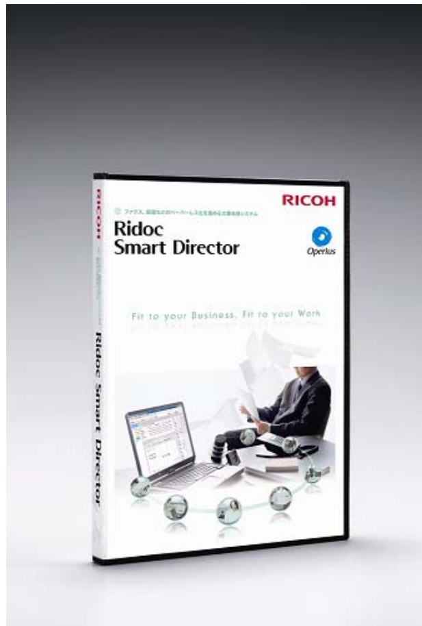
Ridoc Smart Director

※ 1 Ridoc Smart Director アップグレードは、Ridoc Desk 2000シリーズまたはRidoc Desk Navigatorシリーズをお使いのお客様に対しRidoc Smart Directorを割引価格で提供するものです。インストールにはRidoc Desk 2000シリーズまたはRidoc Desk Navigatorシリーズのシリアルナンバーの入力が必要となります。アップグレードの対象商品については、販売担当者にご確認ください。