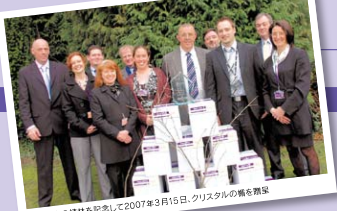
2,500本の植林を記念して2007年3月15日、クリスタルの楯を贈呈

ロンドン サウスバンク大学は、カーボントラスト社よりイノベーション賞を授与されたばかりです。すべての機器のグリーン購買について、製品の消費エネルギー、ランニングコスト、輸送、リサイクルといった、ライフサイクル全体の視点で評価をおこなっています。「環境配慮」が購買決定項目に占めている割合は、およそ10%です。私たちは、製品は信頼性が重要であり、環境への配慮もリコー製品の相乗効果を高める重要な要素であると考えています。